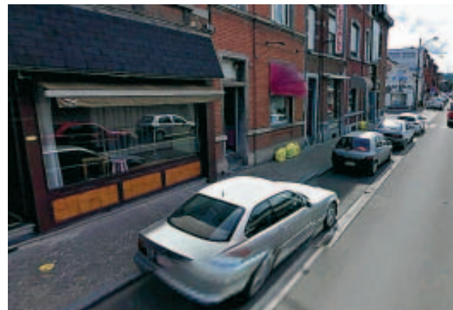
Monsieur X était dans la rue Varin ce jour-là...

Toutes les plaques d'immatriculation sont floutées sur Google Street View? Pas tout à fait... La preuve: si vous allez sur l'application Google, vous verrez que celle de cette voiture, garée dans la rue Varin, devant la vitrine d'une prostituée, est bien visible [...].